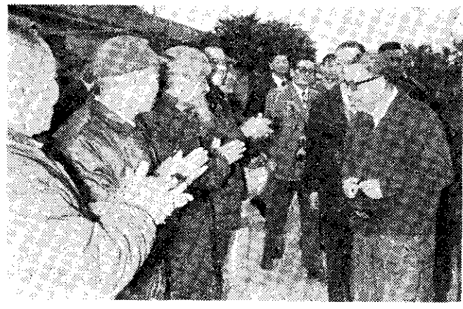
蔣院長訪問新竹市蔡民之家

「仁者無敵」內容宣揚我國在蔣總統英明領導下，自九一八日本侵佔東三省起，與日本浴血奮戰。並報導日本偷襲珍珠港，引起二次世界大戰，直至民國三十四年日本戰敗投降，而蘇俄却乘機進軍東北，扶助毛匪叛亂，種下目前整個世界動亂的禍根。