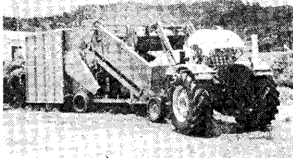
上：用堆肥翻堆機製造堆肥。下：後發祥用移動爐鍋

以上是多明尼加共和國栽培洋菇的情形，雖然他們的方法未盡符合本省洋菇栽培使用，但有些方法仍值得本省菇農參考。