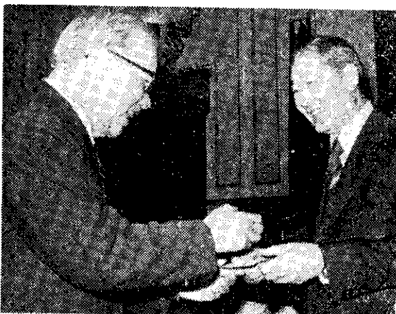
省主席以加萊金贈三軍將士，高魁元部長代收