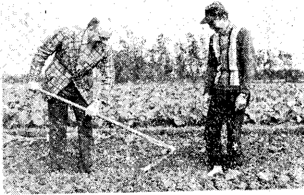
美國農業部猶德訪問桃園農村試用鋤頭

巴伯議長訪華期間，曾拜會了我政府首長，就中泰雙方文經交流的事項，交換意見。並前往故宮博物院和土地改革紀念館等地參觀。