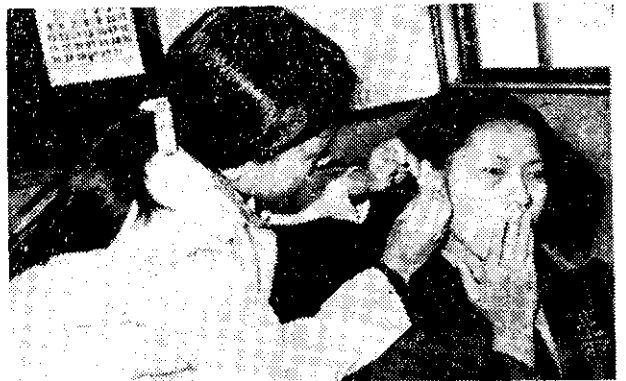
蔡氏總醫院為台北市育聲學校學生針灸治療