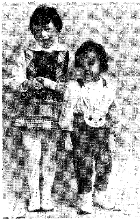
兩個女孩恰恰好 (瑞琴)

(4) 配合社會發展，從事家庭訪問：目前有些家庭兒女雖多，但不知如何去節育，在人口集中地區，如訪視宣導加強家庭計畫，使當地婦女樂於接受，相信更能得到良好的效果。