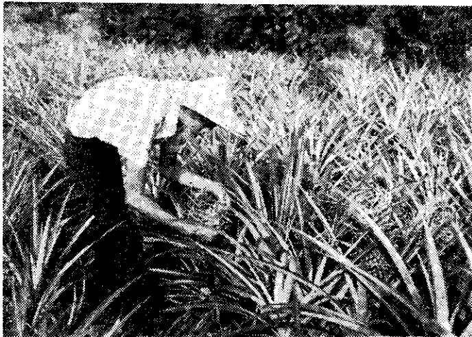
鳳梨覆蓋防止日燒

株葉片交錯，覆蓋地面，因此雜草少，還有保土、保溫、保肥的功效，對鳳梨生育非常有利。