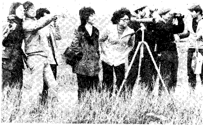
鳥類生活觀察 (南明山)

偉大的台灣森林像這樣兼收併蓄，累積了無盡的寶藏。讓我們維護寶島長春，永保綠色，才能夠經常享受鳥語花香。