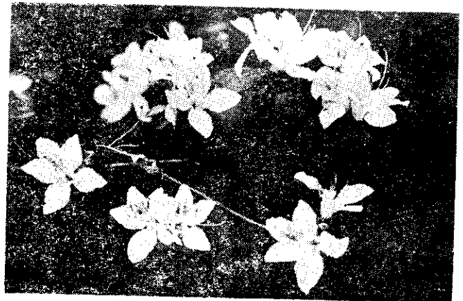
埔里杜鵑花冠粉紅色，產中部500~1,200公尺山地。