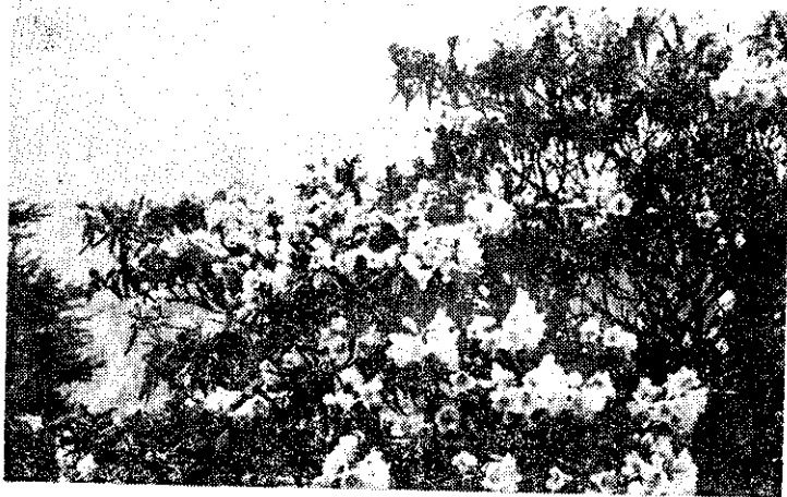
森氏杜鵑白色花冠，上有紫色斑點，產3,000公尺以上山地。

欣賞與栽培，歷史極為悠久。唐朝大詩人白居易有「題山石榴」詩，即指杜鵑。宋朝有更多的詩詞描述杜鵑花，多強調其鮮紅之花色。如梅堯臣之「顏色勝膠鬲」，辛棄疾之「血染赭羅巾」，高菊卿之「淚血染成紅杜鵑」等詩句。因此引出杜鵑啼血之傳說。