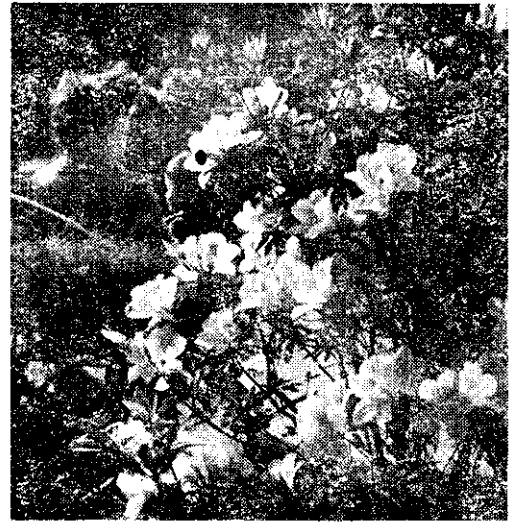
台北新公園內盛開的杜鵑花 (薛聰賢)