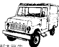
利大鐵牛有頂客貨兩用車