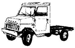
利大鐵牛貨車底盤