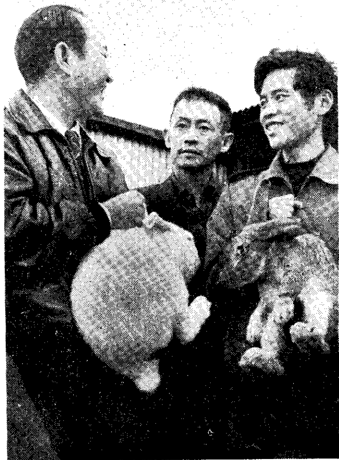
農復會黃暉達技正（左）詢問兔場經營情形（河明）

許場長的為人，克己耐勞、腳踏實地的創業精神，更深受高小姐的愛慕和激賞。許場長也看得出高小姐將可成爲他來日事業上最好的幫手，兩相傾慕，互許終身，美滿姻緣玉兔牽。據聞喜事將近，這一對才子佳人今後將同心攜手，爲他們的養兔事業而努力。誰說農村青年對象很難找？誰說小姐沒人願嫁草地區？（簡）