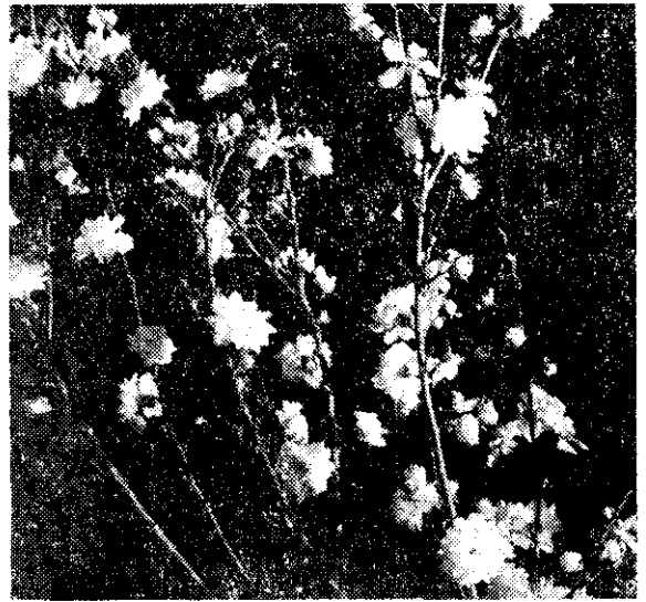
白雪郁李 Prunus japonica Thunb. var. multiplex Mak. 原產我國及日本。上圖為園藝觀賞種，花大、重瓣、白色，早年自日本引入台灣，現普遍栽培庭園中。