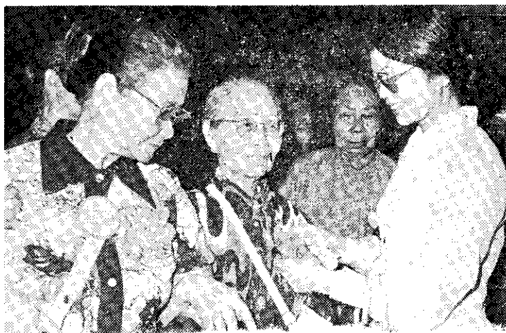
香港阿公阿婆回國游覽，並接受獻花

這項由國立故宮博物院、文化復興推行委員會、救國團及各縣市政府合作舉辦的展覽，內容有故宮博物院簡介、文物圖片一〇〇幅、裱裝名畫複製品二十幅、文物複製品雕漆五件、銅器九件、瓷器一件、