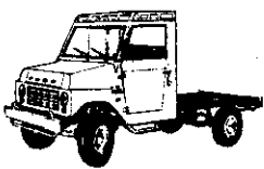
利大鐵牛貨車底盤