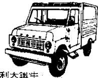
利大鐵牛 有頂客貨兩用車