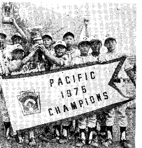
中華少棒隊奪得今年遠東區少棒錦標賽冠軍