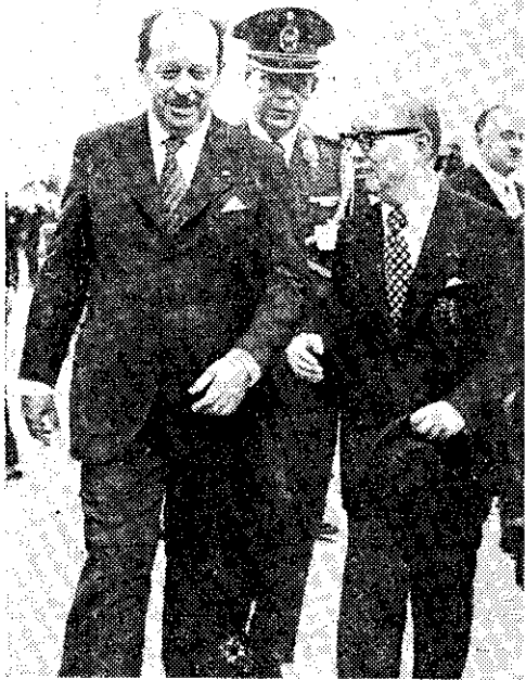
巴拉圭總統(左)來訪，蔣總統在機場迎接

隨行人員包括外交部長薩比納、公共工程暨交通部長加塞雷斯、工商部長吳嘉德、農牧部長貝多尼、軍事將領、工