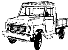
利大鐵牛低欄板貨車