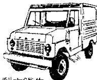
利大鐵牛 有頂客貨兩用車