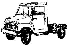
利大鐵牛貨車底盤