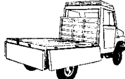
利大鐵牛活動欄板貨車