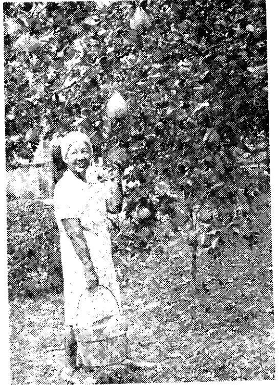
——庭院種果樹，可美化環境，又有果實可吃(呂)——