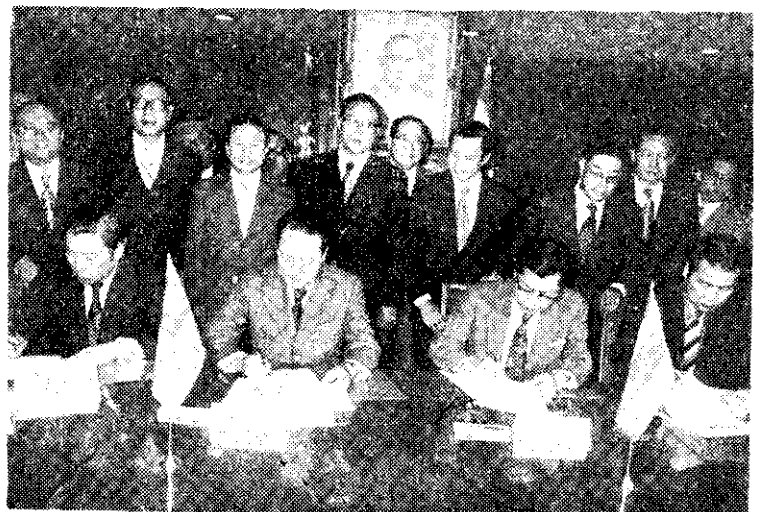
我國與泰國代表(右)簽訂玉米貿易協定

諾魯共和國總統戴羅伯，於十二月九日抵達我國訪問，並主持諾魯航空公司客機首航台北典禮，中諾航線有七千多哩航程，每週兩班次。