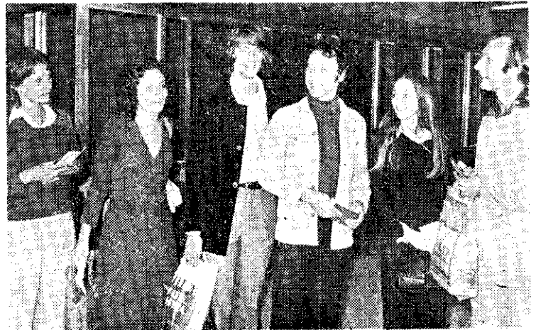
英國洛埃倫敦芭蕾舞團來我國演出(中央社)