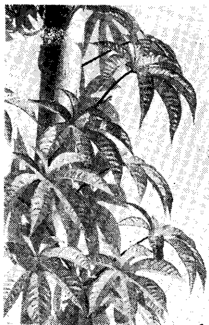
生長旺盛的木玫瑰

果莢開裂之後，可用噴霧器噴以假漆或塗料，增加木質化的光澤，並可經久儲藏。木玫瑰的品種，除了本文介紹的普通木玫瑰外，尚有原產印度小花種木玫瑰，及原產於波利尼西亞的木玫瑰，這兩種木玫瑰，本省栽培甚少。