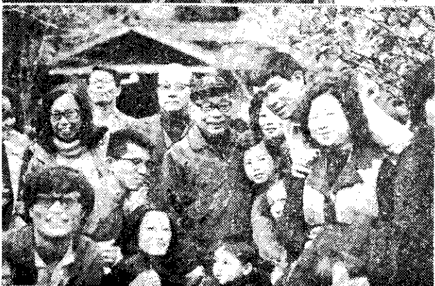
在廬山與青年學生合影

個未定名的「翁戎螺」活化石，在二千萬年前以上，屬於中新世，最大的特徵，是沒有肚臍。