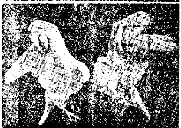
乳鴿生長情形：鴿蛋