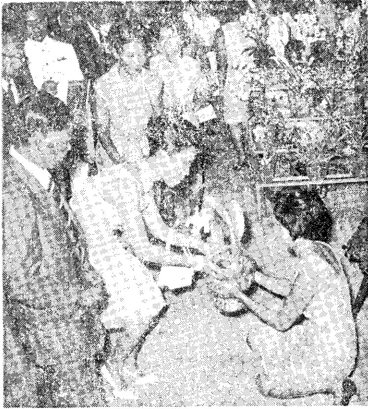
Mrs. Thonglor 向泰國皇后呈獻各賞蘭花 "Diamond Crown"