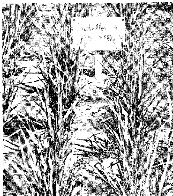
● 整地後4天內每分地施用3公斤馬上除