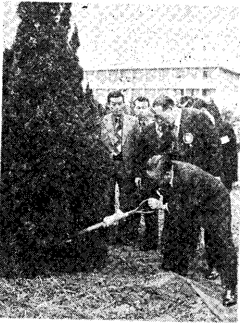
蔣經國院長於 國父紀念館種植柏樹，紀念植物節

民國二二年元旦，日軍終於擴大事端，達成占領山海關的野心。日本這種侵略行爲，受到國際聯盟的責難。