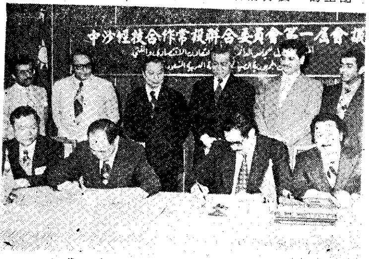
第一屆中沙經技合作委員會簽署典禮

日本產經新聞連載的「蔣總統秘錄——中日關係八十年之証言」中，於三月十日、十一日和十二日三天，敘述日