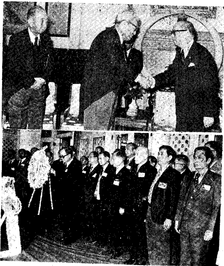
上：嚴總統接見來參加總統 蔣公逝世周年活動的日本國會議員訪華團團長坊秀男（中）及日本前首相岸信介。下：海外僑胞代表向 蔣公陵寢致敬。