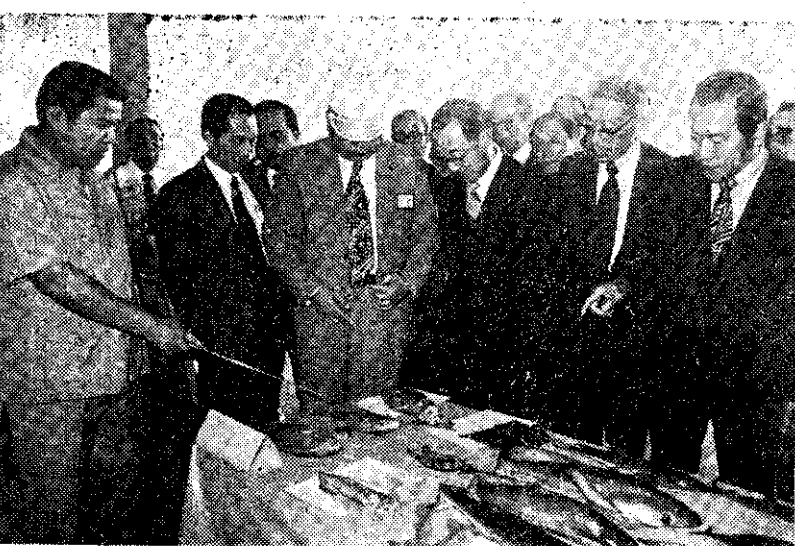
中央銀行總裁俞國華(右三)等參觀前鎮魚港魚貨樣品

農廳為配合加速農建改進農產運銷的政策，除對若干作物實施保證價格及設置平準基金外，又採取下列各項重要措施，以增進農民收益。 (1) 新擴建農產品批發市場，便利農產交易。 (2) 促進農產品交易法之草擬。 (3) 加強輔導農民拓展共同運銷業務：①辦理毛豬共同運銷，及促進冷凍豬肉外銷；②辦理果菜共同運銷，及試辦契約生產保價運銷。 (4) 輔導洋蔥共同運銷，爭取日本