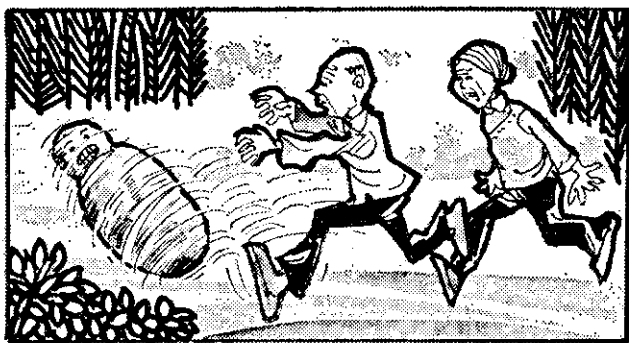
「餓頭人別跑，不讓人吃就不吃！……。」

「小老頭和小老太太都沒有追到我，大黑狗對我也無計奈何，你這個餓熊更不必說。我是個愛賽跑的餓頭人！」