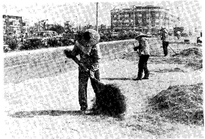
尚屏區第一期稻作豐收，農民忙著晒谷

省傳染病研究所最近化驗澎湖蝸牛，發現感染有廣東住血線虫的比率很高，食者可能發癢、頭痛、麻痺，是很可怕的寄生虫病，應小心防範。