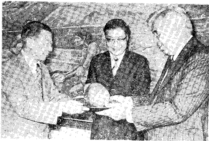
美國新聞處處長(右)致贈北京人頭骨模型給我歷史博物館

這條航線目前每週三、五、日各往返台北嘉義一航次，單程票價六二〇元，以後如旅客增加，將適時機動調整，以應實際需要。