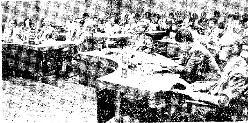
第三屆亞太地區社會發展研討會(中央社)

全國第一屆農業技術展覽，六月二二日起至七月二日，在台北市南海路國立台灣科學教育館展出。