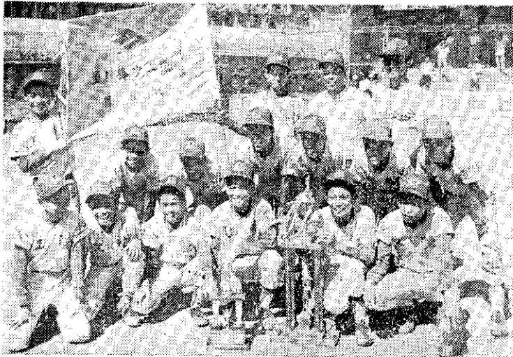
花蓮榮工隊獲得全國少棒選拔賽冠軍

世界少棒聯盟預定八月二四日舉行初賽。八月二五日舉行遠東隊對歐洲隊賽。在八月二六日舉行複賽，八月二八日舉行世界冠軍爭奪賽。