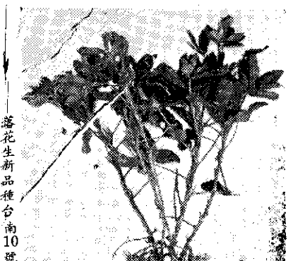
落花生新品種台南十號

台南農業改良場育成落花生新品種，經命名為台南一〇號，並推廣種植。此新品種是以台南六號與 Florispan Runner 人工雜交