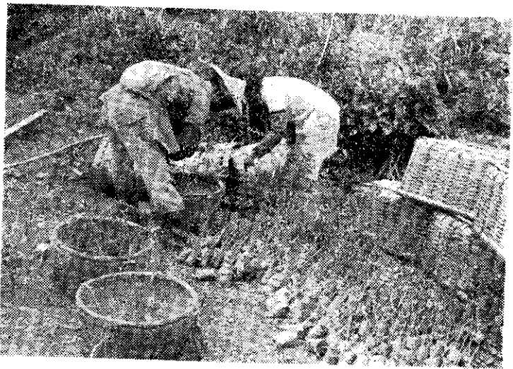
——屏東縣山胞分配苗木，加強山地造林(高公)——

屏東有山地保留地六二、六一五公頃，其中宜林地為五二、四七四公頃，佔全部面積八三·八%，除天然林、山胞造林、公共造產林及公有造林