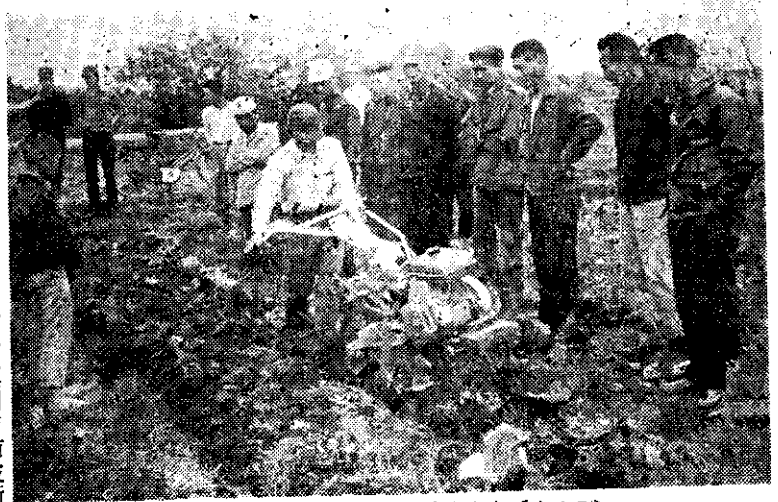
— 菜園利用耕耘機整地，節省勞力成本 (陳培昌) —

每日契約進貨數量暫定為五〇公噸，供應果菜公司。參加契約生產鄉鎮的供應數量目標，最少的為一公噸，最多的為五公噸，隨各鄉鎮而不同。栽培夏季蔬菜要注意：(1) 選擇耐濕品種。