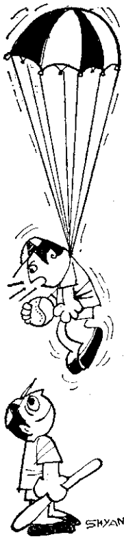
(譯自「媽媽作的童話」·太田澄子作)