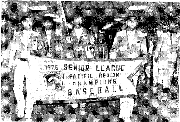
中華青少棒隊奪得遠東區青少棒球賽代表權 (中央社)

中國大陸災胞救濟總會，呼籲海內外同胞發揮民族同胞愛，本人饑己饑、人溺己溺的人道立場，踴躍捐輸，儘速救濟大陸災胞，各界捐款由台灣銀行及其各地分行支行代收，