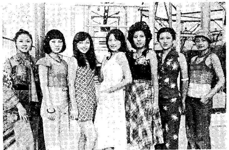
北市攝影記者聯誼會舉辦芙蓉仙子選拔，進入決賽的候選人