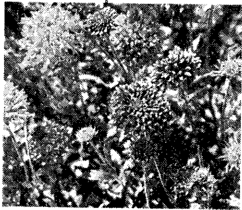
外國庭園常見的天人菊

繁殖一般是在春天播種。發芽適溫爲一五~二〇度左右。播種後要略加覆土。宿根性的大天人菊，可以在九月以後到翌年三、四月間，行分株繁殖，甚至用芽插或根插來繁殖，繁殖力很旺盛。天人菊的花期主要在七、八月間，有時也可以一直盛開到秋天。