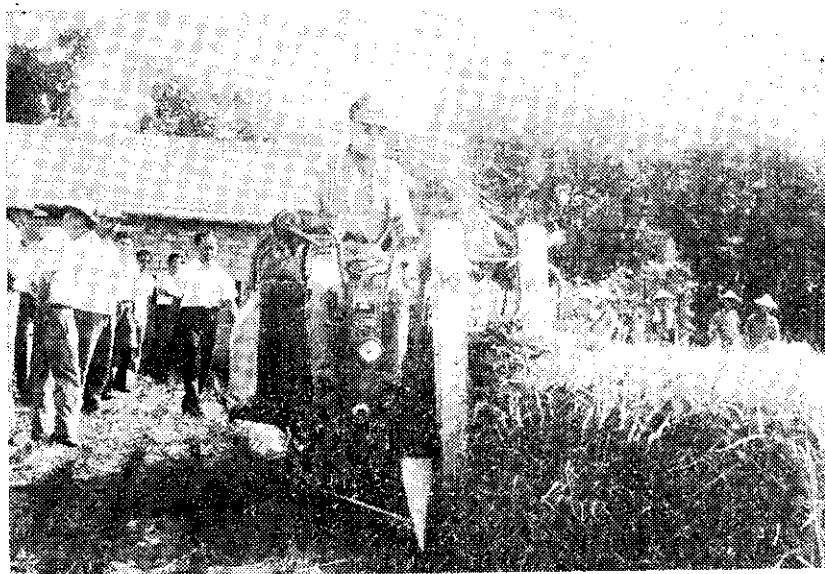
示範村使用水藥聯合收穫機