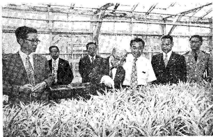
嚴總統巡視鳳山熱帶園藝試驗分所 (中央社)