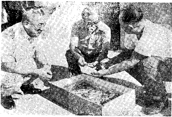
復育專家指導澎湖魚民培育茶種苗 (中央社)

最近，粵、閩、浙等省沿海地區及江西鐵路沿線，情勢非常混亂。各地區的反毛勢力相繼展開活動，散發傳單，號召民衆起義，責罵毛酋禍國殃民，死有餘辜。