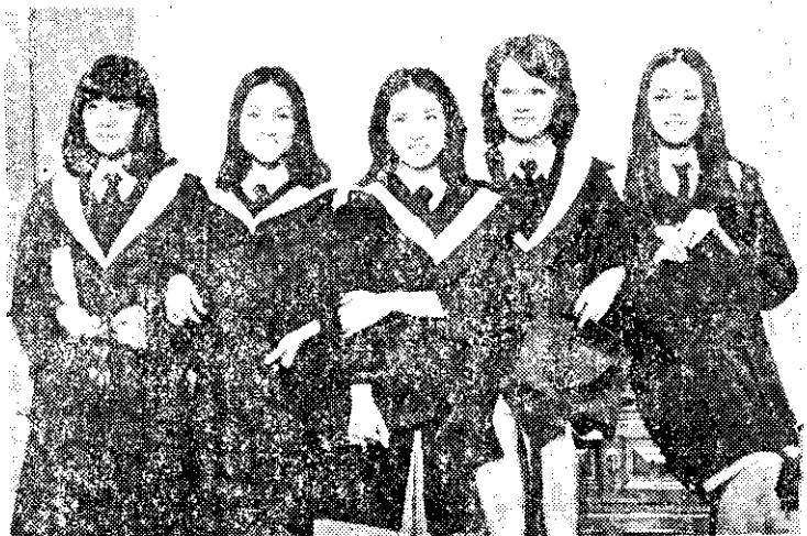
中影拍攝「蝴蝶谷」，五位女主角飾演大學生（中央社）