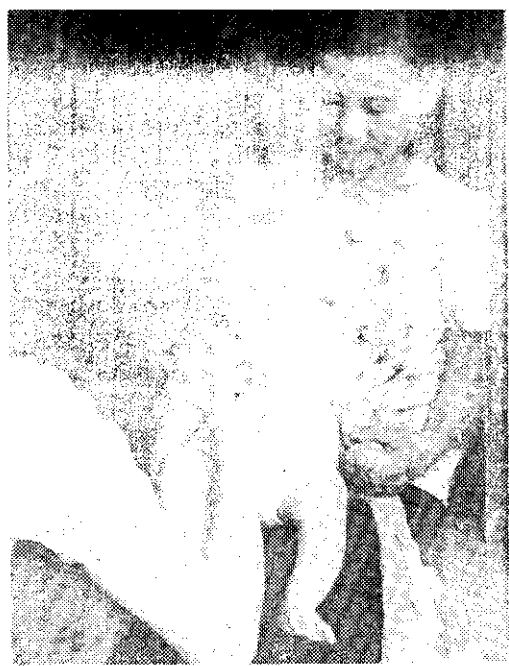
——用母乳哺育的嬰兒，發育良好（薛聰賢）——