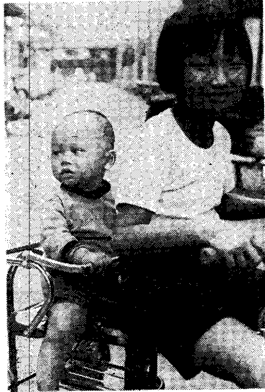
——生育有間隔，孩子長得壯（薛聰賢）——

產後無月經多半是不排卵的，不過有些婦女在產後第一次月經來潮以前就已經排卵，就已經具有生育的能力了。