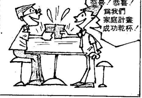
生女孩同樣歡喜 (薛聰賢)