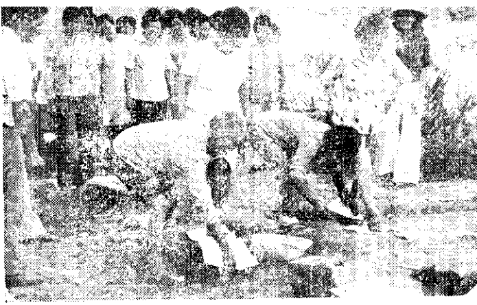
農村婦女康樂活動