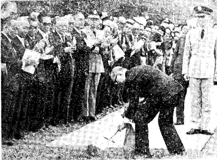
嚴總統為中正紀念堂舉行破土典禮

蔣總統秘錄——中日關係八十年之証言」，於十月三十日、三十一日和十一月二日三天，敘述民國三九年中美關係因史迪威擡奪統帥權而幾陷惡化，幸賴赫爾