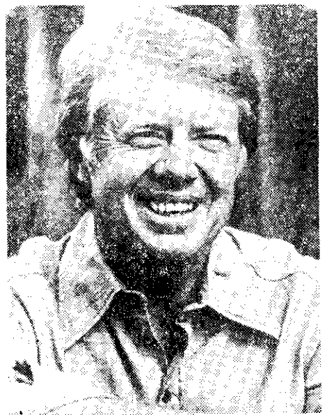
美國第三十九任總統卡特

蔣總統秘錄——中日關係八十年之証言」，於十月三十日、三十一日和十一月二日三天，敘述民國三九年中美關係因史迪威擡奪統帥權而幾陷惡化，幸賴赫爾