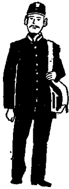
法國郵務士的裝束

這種由人類粘液製造出來的強力天然麻醉劑名叫「B-1安多非因」，是由加州大學醫學院的荷爾蒙研究室主任李卓皓提出的。