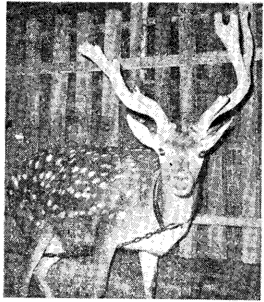
發育良好的梅花鹿 (楊木林)

鹿類在台灣有自然繁殖極盛的時期，文獻中有「窮年捕鹿鹿亦不竭」的記載。鹿雖屬野獸，但因生長快，且鹿性易馴，因此有計畫的飼養，能供給人類生活上必需的資源，如鹿的肉、皮、角、茸、乳等。