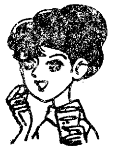
口服避孕藥要按時服用

施行之前，必須慎重考慮，才能作決定。決不可有「再來一次」的心理。所以要施行這種手術的夫婦，必須要有不想再生育子女的決心，才不致於將來後悔。