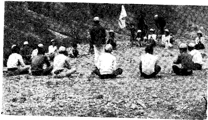
竹南鎮四健會會員郊游康樂活動(徐金俊)

訓練內容有：(一)本省水稻增產辦法，(二)水稻病虫害及其防治方法，(三)施藥機械使用保養講解及實習，(四)農藥簡介及施藥技術，(五)農藥殘毒及農藥中毒預防與急救。(琮元)