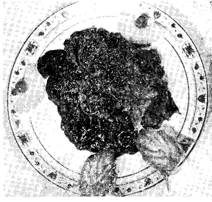
上：鳳凰蛋捲，下：素燒雞