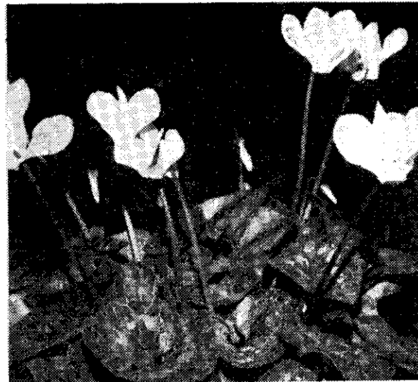
上：重瓣九重葛 中：瓜葉菊 下：仙客來（阿那）

依照台灣習俗，桔與吉字同音，四季桔（四季吉）代表春、夏、秋、冬都是萬事如意，歲歲平安，金黃色的果實充滿著吉祥好預兆，因此很多人喜歡在春節期間，在家中放置一盆結實累累的四季桔，以象徵好的開始，在香港更爲普遍，很受歡迎。 茲將四季桔的盆栽要領略述如下，供有興趣栽培者之參考—— (一) 栽植用苗分爲兩種，一種是由盆中直接育成，另一是先在育苗床照