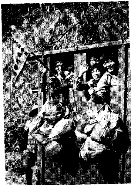
森林系學生搭纜車前往林區實習(呂福和)

林務局肩負重任，自當激發全體員工，益加踴躍，以求經營改革方案之全部實現，尤望社會各界仍予繼續指導與支持，是所感盼！