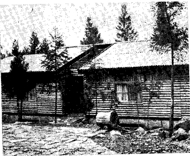
青年活動中心別墅

食場所並各附設有土產部外；還有停車場附近的十多家土產商店，專售本地各種特產品，如凍頂烏龍茶、筍干、筍絲、竹工藝品、紅薯薯等。茲為供遊客參考，將各旅社名稱、房間數、可容納人數，價格列表如下：