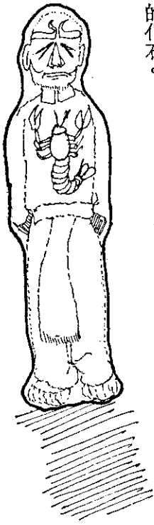
最後形成一個化石

蠍子精回洞，發現自己身強力壯，高興萬分。但是一百年過了，就漸漸覺得不舒服，臉上密層層的皺紋顯得奇醜無比，連同類的蠍子都不願意和他接近。想吃吃不下，走路走不動，再不會變化什麼。活受罪的生活，弄得他時時刻刻想死，比過去希望長生不老更迫切。他一直活着屬於一種懲罰。而後逐漸形成一個只剩心房些微跳動的化石。