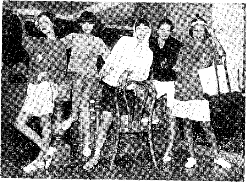
夏日少女日常輕便服裝

使用時先在箱底及四周，舖上乾淨的白布或白紙，並放些樟腦片或丸，以防衣物吸收到箱中的油漆濕氣及防避虫害侵襲，使衣物遭受損害。