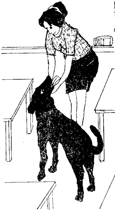
「歡迎你常來玩，孩子們都喜歡你。」