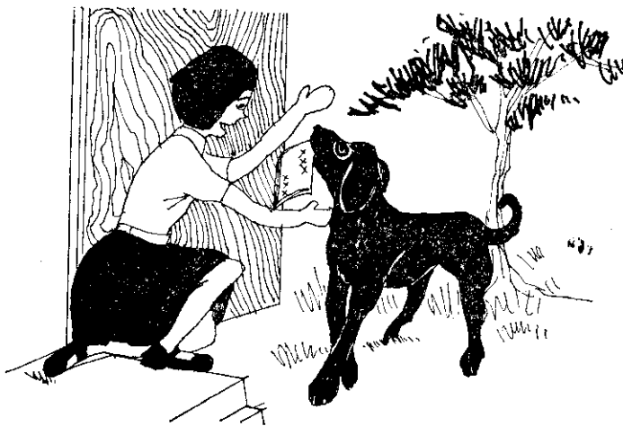
「謝謝你，小黑，你替我把習字簿帶來了。」